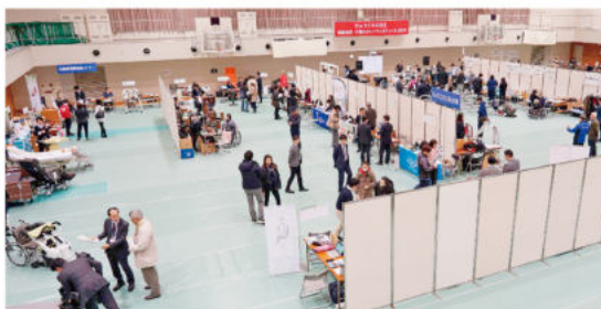
※令和元年度のフェスティバルの様子