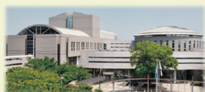
福祉のまちづくり研究所